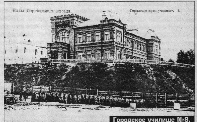
Городское училище №8.