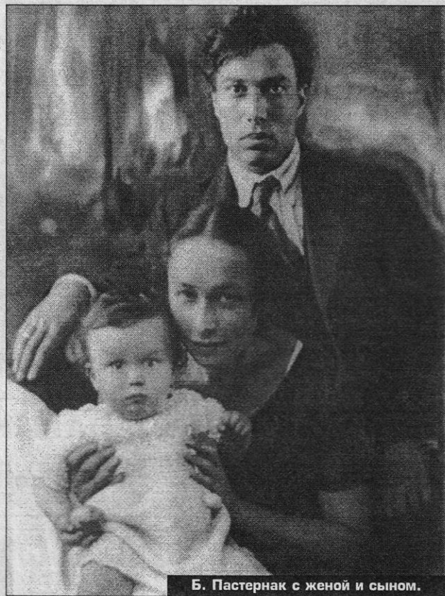
Б. Пастернак с женой и сыном.