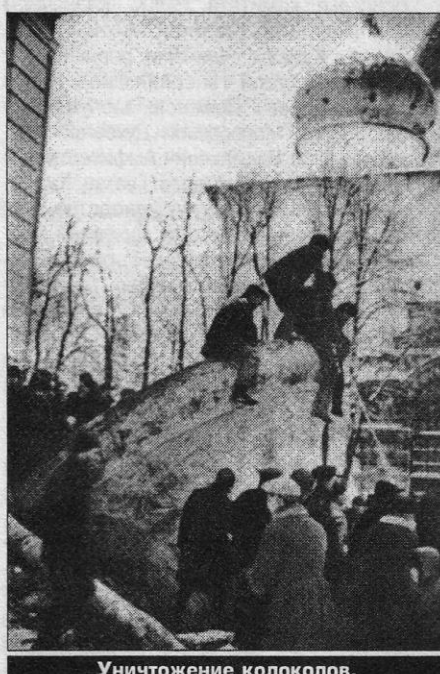
Уничтожение колоколов.

Январь 1930 г. (70 лет назад) с лаврской колокольни была сброшена часть колоколов и среди них знаменитый Царь-колокол — самый большой действующий колокол дореволюцион-